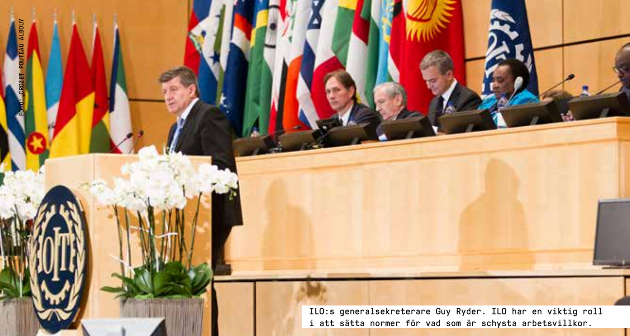
ILO:s generalsekreterare Guy Ryder. ILO har en viktig roll i att sätta normer för vad som är schysta arbetsvillkor.