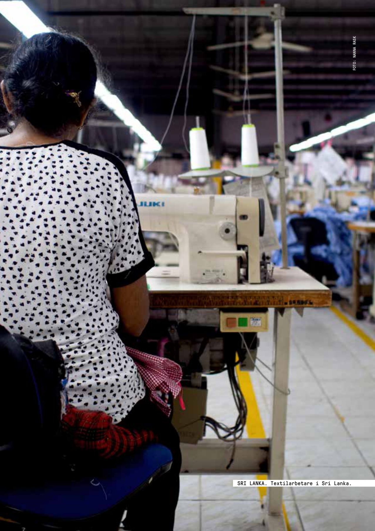
SRI LANKA. Textilarbetare i Sri Lanka.