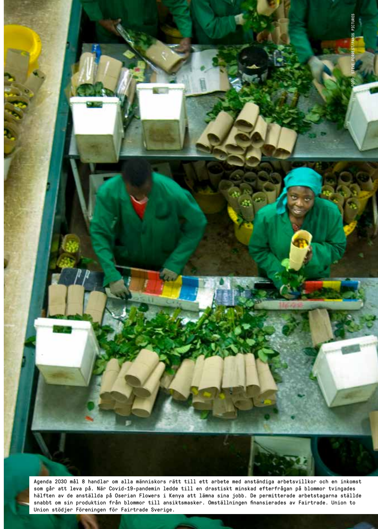
Agenda 2030 mål 8 handlar om alla människors rätt till ett arbete med anständiga arbetsvillkor och en inkomst som går att leva på. När Covid-19-pandemin ledde till en drastiskt minskad efterfrågan på blommor tvingades hälften av de anställda på Oserian Flowers i Kenya att lämna sina jobb. De permitterade arbetstagarna ställde snabbt om sin produktion från blommor till ansiktsmasker. Omställningen finansierades av Fairtrade. Union to Union stödjer Föreningen för Fairtrade Sverige.

Covid-19-pandemin har slagit hårt mot den globala arbetsmarknaden och särskilt svårt drabbade är arbetstagare i länder med utbredd fattigdom. ILO rapporterade i september 2020 att antalet förlorade arbetstillfällen är betydligt fler än vad som beräknades under våren. Miljontals migrantarbetare och människor som tjänar sitt levebröd i den informella ekonomin har fått försämrade försörjningsmöjligheter och står utan skyddsnet. Enligt ILO finns det nu risk att decennier av fattigdomsbekämpning går förlorad. Därför efterlyser organisationen krafttag när det gäller att ge unga kvinnor och män i låginkomstländer möjligheter till utbildning, kompetensutveckling, jobb och utsikter till ett anständigt liv. Detta är avgörande för en verkligt global återhämtning efter pandemin och en bättre framtid för alla.