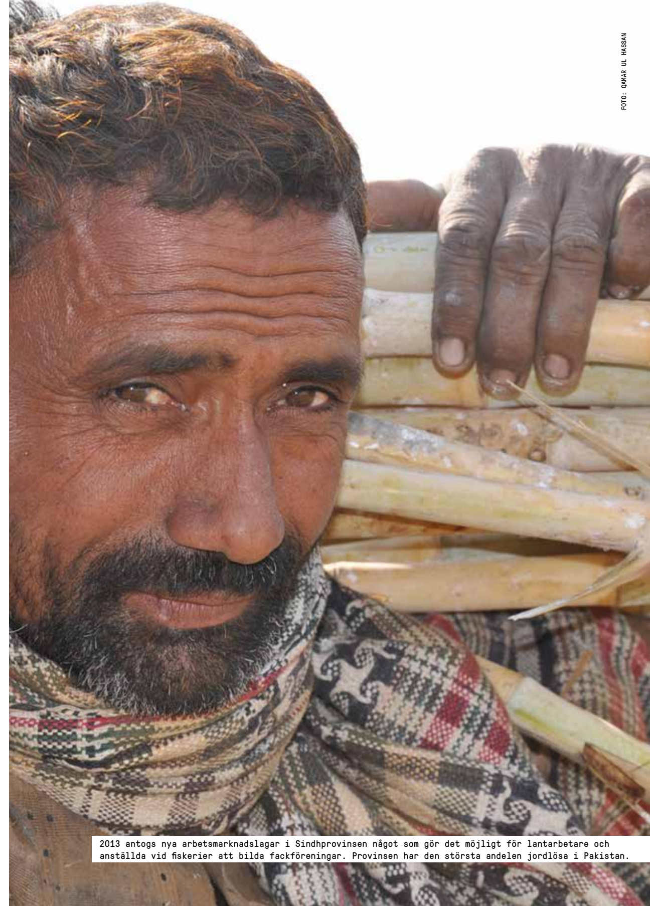
2013 antogs nya arbetsmarknadslagar i Sindhprovinsen något som gör det möjligt för lantarbetare och anställda vid fiskerier att bilda fackföreningar. Provinsen har den största andelen jordlösa i Pakistan.

Det globala facket IUF och det svenska fackförbundet Kommunal driver ett regionalt projekt i Asien, där Pakistan ingår, som handlar om att organisera lantarbetare. Efter hårt lobbyarbete av IUF, och deras anslutna pakistanska fackförbund, antogs 2013 nya arbetsmarknadslagar i Sindhprovinsen – som har den största andelen jordlösa i Pakistan. Den nya lagstiftningen gör det möjligt för lantarbetare och anställda vid fiskerier att organisera sig fackligt, vilket är ett kraftfullt verktyg i kampen mot tvångsarbete.