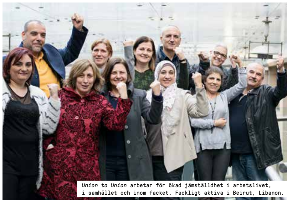
Union to Union arbetar för ökad jämställdhet i arbetslivet, i samhället och inom facket. Fackligt aktiva i Beirut, Libanon.