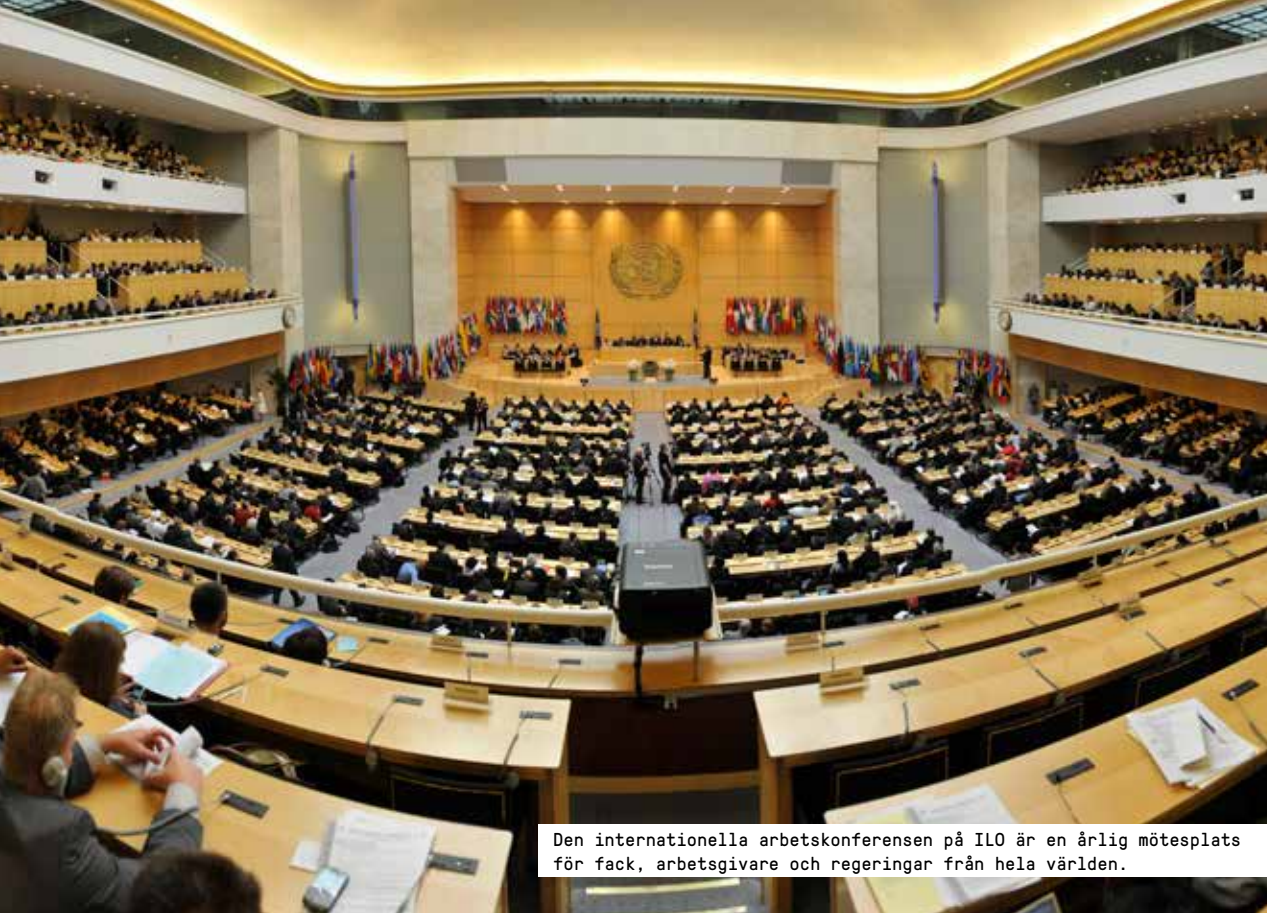
Den internationella arbetskonferensen på ILO är en årlig mötesplats för fack, arbetsgivare och regeringar från hela världen.