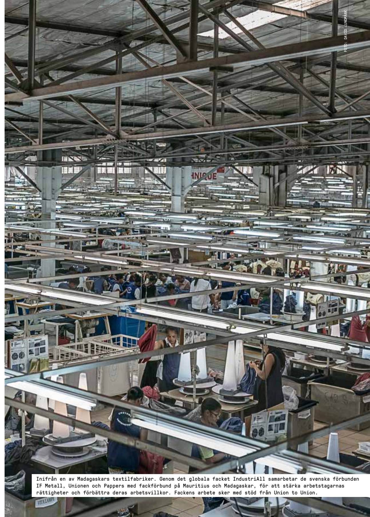
Inifrån en av Madagaskars textilfabriker. Genom det globala facket IndustriAll samarbetar de svenska förbunden IF Metall, Unionen och Pappers med fackförbund på Mauritius och Madagaskar, för att stärka arbetstagarnas rättigheter och förbättra deras arbetsvillkor. Fackens arbete sker med stöd från Union to Union.

Den svenska ILO-kommittén är trepartistiskt sammansatt med representanter från regeringen, de fackliga centralorganisationerna LO, TCO, Saco och arbetsgivarorganisationerna Svenskt Näringsliv, Sveriges Kommuner och Regioner och Arbetsgivarverket.