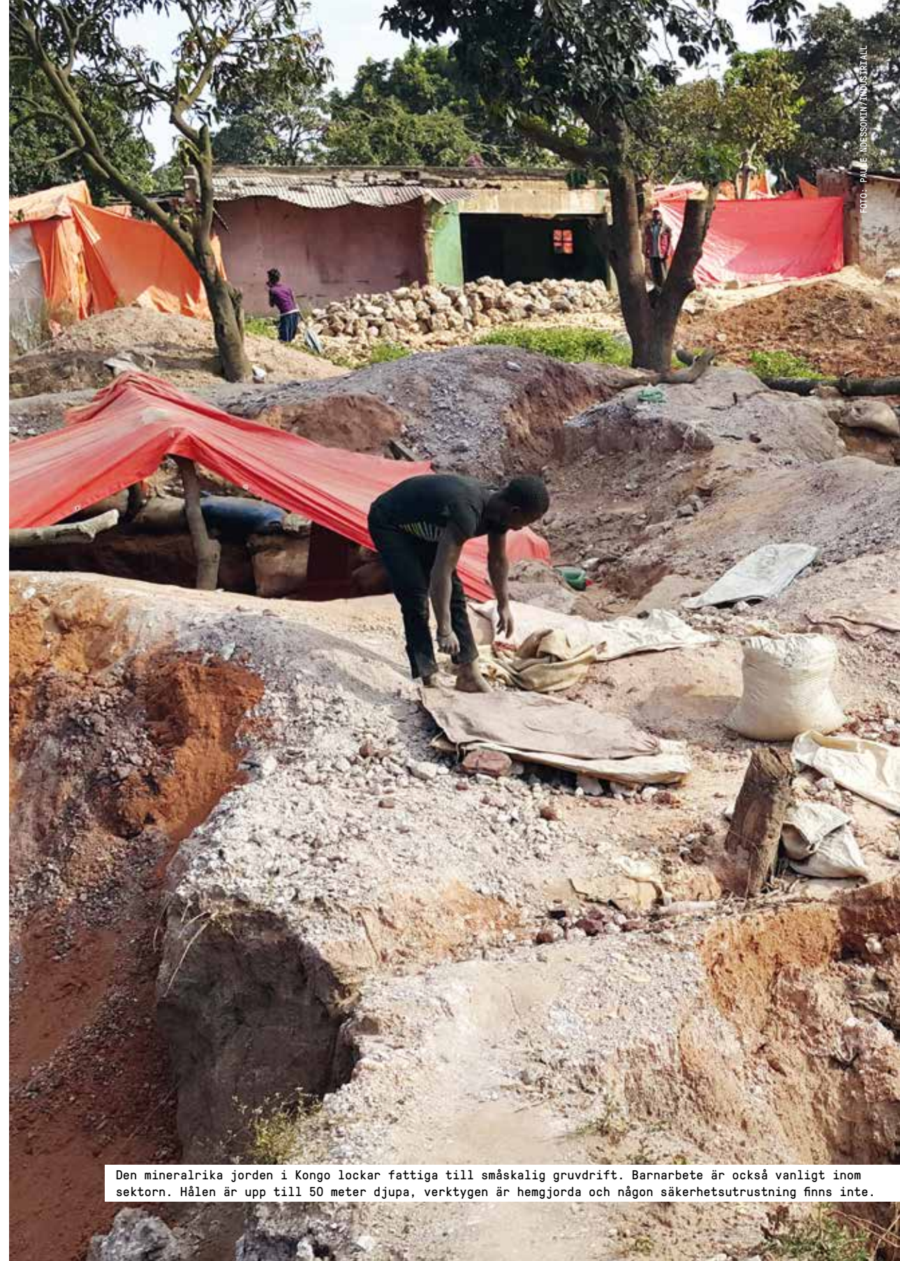
Den mineralrika jorden i Kongo lockar fattiga till småskalig gruvdrift. Barnarbete är också vanligt inom sektorn. Hålen är upp till 50 meter djupa, verktygen är hemgjorda och någon säkerhetsutrustning finns inte.

Ett annat sätt att motverka barnarbete är att satsa på att alla barn ska få tillgång till utbildning och bra kvalitet på undervisningen. Framförallt är det många av världens lärarförbund som på detta sätt arbetar för att få fler barn att börja skolan, minska skolavhoppet och därmed öka barnens chanser att ta sig ur fattigdomsspiralen.