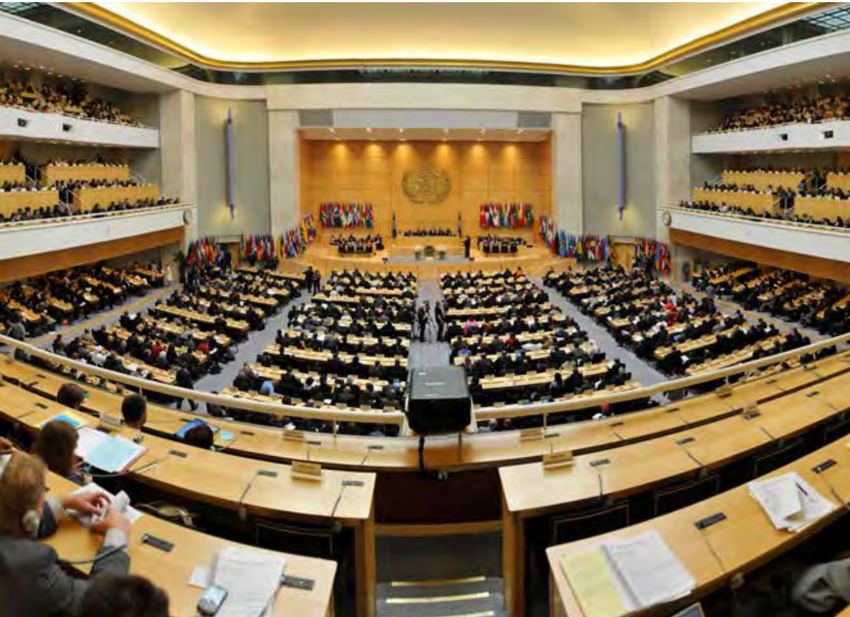
Den internationella arbetskonferensen på ILO är en årlig mötesplats för fack, arbetsgivare och regeringar från hela världen.