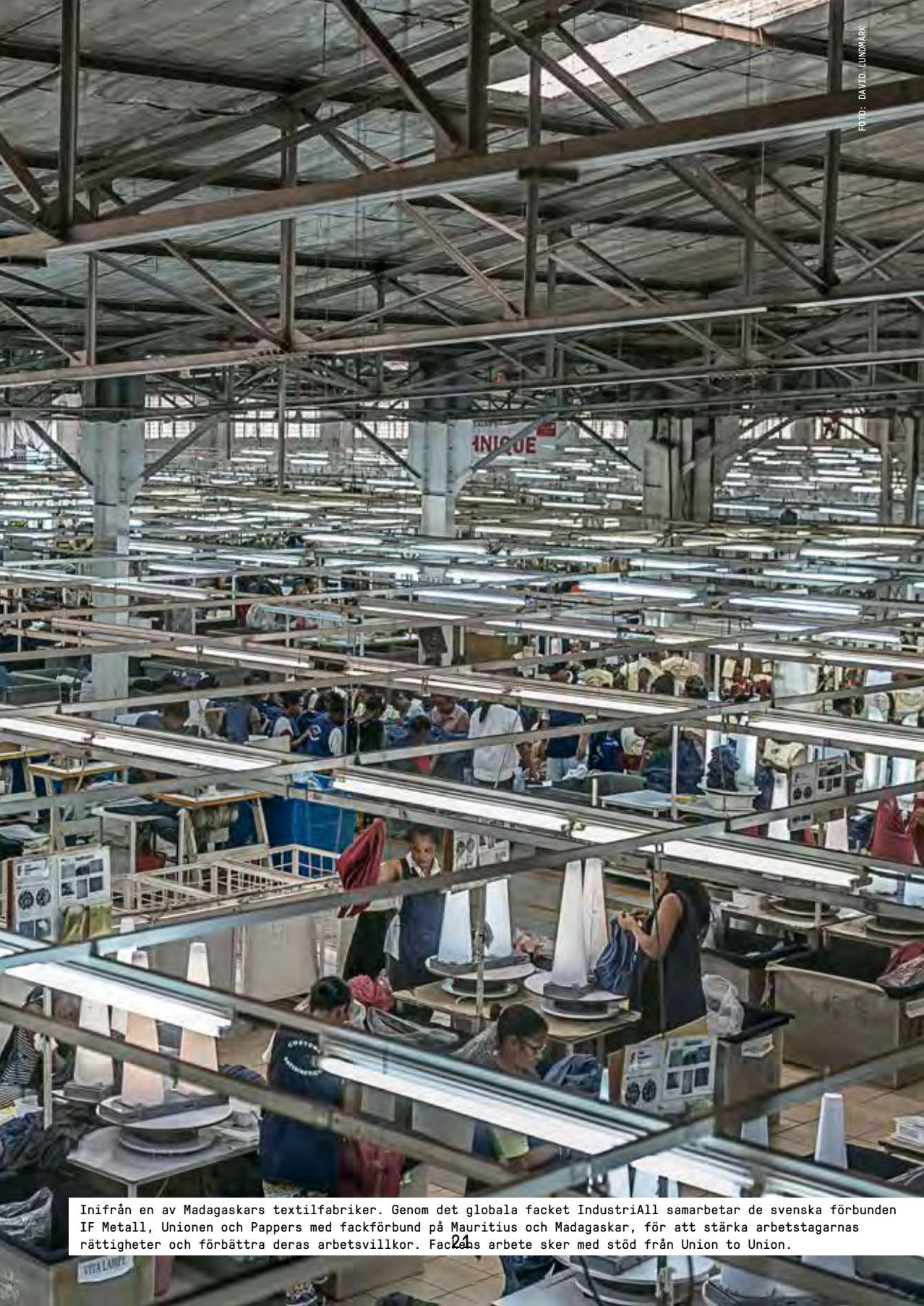
Inifrån en av Madagaskars textilfabriker. Genom det globala facket IndustriAll samarbetar de svenska förbunden IF Metall, Unionen och Pappers med fackförbund på Mauritius och Madagaskar, för att stärka arbetstagarnas rättigheter och förbättra deras arbetsvillkor. FacLebs arbete sker med stöd från Union to Union.