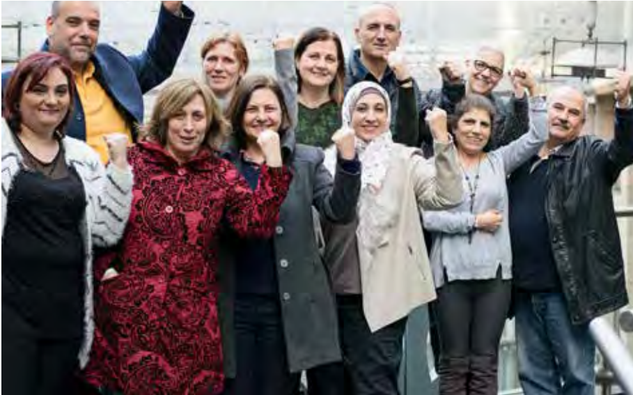
Union to Union arbetar för ökad jämställdhet i arbetslivet, i samhället och inom facket. Fackligt aktiva i Beirut, Libanon.