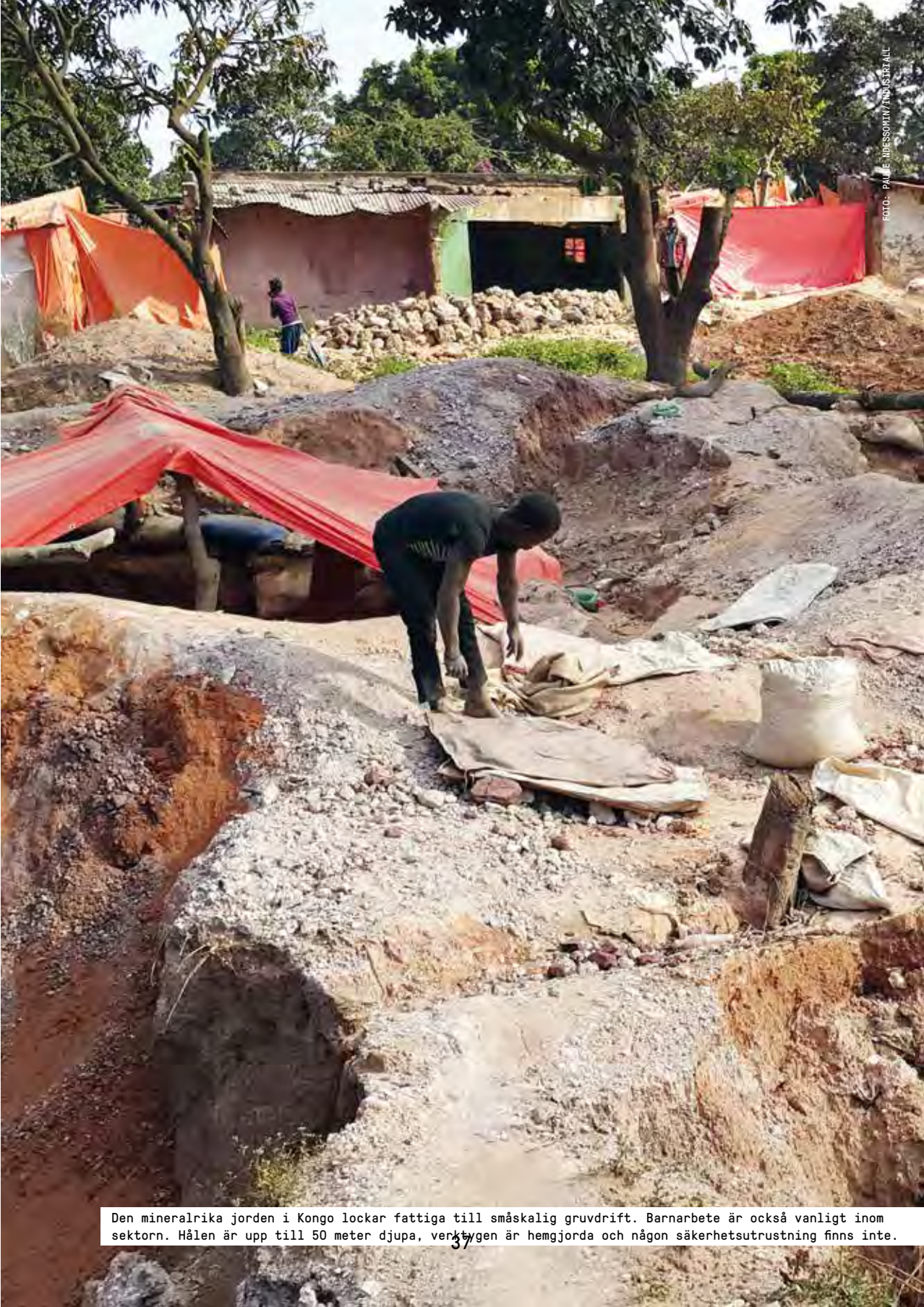
Den mineralrika jorden i Kongo lockar fattiga till småskalig gruvdrift. Barnarbete är också vanligt inom sektorn. Hålen är upp till 50 meter djupa, verktygen är hemgjorda och någon säkerhetsutrustning finns inte.